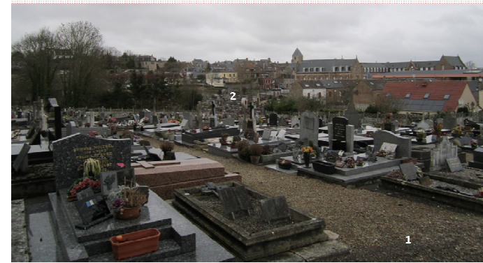
Au premier plan, la 2ème partie du cimetière, au second plan la première partie, beaucoup plus ancienne

L'autre pour des travaux de sécurité et d'accessibilité dans le cimetière: l'état du cimetière (partie 1 et 2) est particulièrement préoccupant. D'une part, les murs de clôtures sont à refaire car ceux-ci sont dans un état regrettable et constituent ponctuellement un vrai problème de sécurité (risque d'effondrement). D'autre part, l'accessibilité du cimetière est particulièrement malaisée. Les allées gravillonnées, aux pentes diverses ne permettent pas la circulation des personnes à mobilité réduite ; Leur dimensionnement est également problématique. Aussi, les cheminements et les entrées doivent pouvoir être réétudiés afin qu'ils soient praticables pour les personnes à mobilité réduite. Certaines parties doivent être drainées et stabilisées afin de permettre une circulation confortable pour tous dans toutes les allées. Par ailleurs, certaines sépultures abandonnées, présentent un caractère historique et seront réparées par la commune, alors qu'une vaste opération de reprise de concession, et de réappropriation du cimetière sera parallèlement engagée. Le coût prévisionnel de ces travaux est estimé à 797.000 € HT. Une subvention de 199.250 euros est sollicitée.