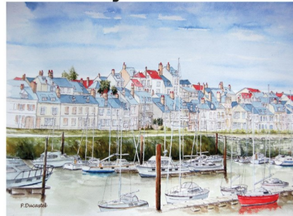
Ancien Tribunal de commerce Place des pilotes