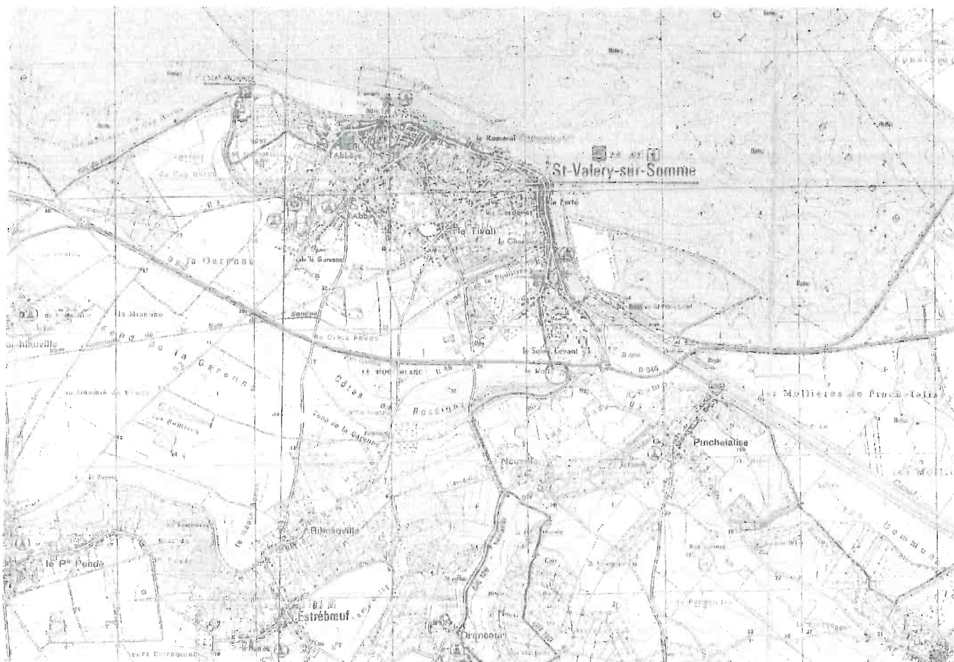
Localisation du projet sur l'extrait de la carte IGN 2107 OT (carte sans échelle)

Le projet d'extension limitée de la zone UC au lieu-dit du Mollenel concerne les parcelles cadastrées AM n°61, 117 et 150 parties pour une surface totale de 1 500 m 2 environ.